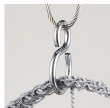
ワイヤーロープ + Sカン