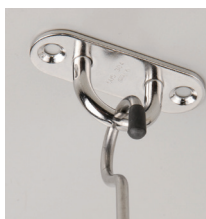
パッドアイ + ロングSカン