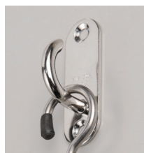
オープンパッドアイ + ロングSカン