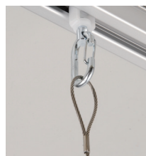
ワンタッチランナー + ワイヤロープ