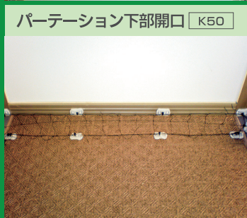
パーティション下部開口 K50