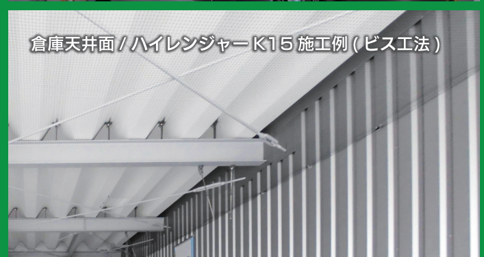
倉庫天井面 / ハイレンジャーク K15 施工例 (ビス工法)