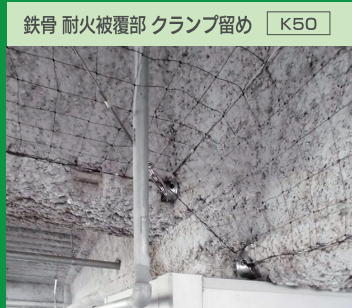
鉄骨 耐火被覆部 クランプ留め K50