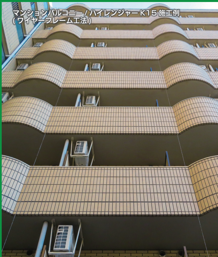
マンションバルコニー / ハイレンジャーク K15 施工例 (ワイヤーフレーム工法)