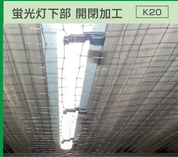
蛍光灯下部 開閉加工 K20