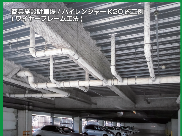
商業施設駐車場 / ハイレンジャーク K20 施工例 (ワイヤーフレーム工法)