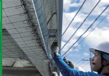
庇 底面 ワイヤースタイル工法 K50